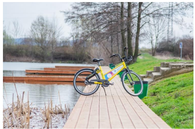
Miejsce spotkań wielu jaworzan