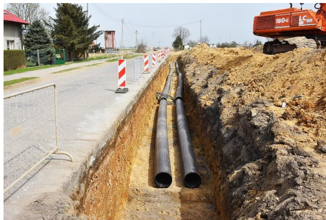
W trakcie budowy