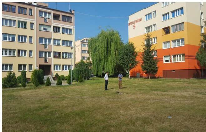
Zrealizowaliśmy projekt razem z mieszkańcami