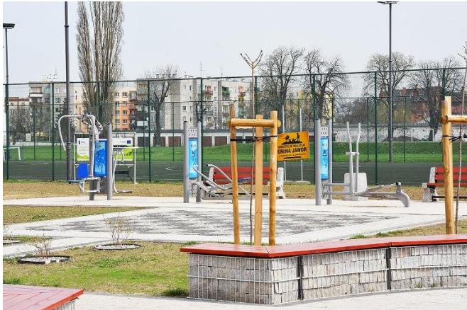
W miejscu klepiska pojawił się nowoczesny skwer

✚ „Rozwój zielonych terenów Jawora jako element systemu wymiany i regeneracji powietrza w gminie”. Zadanie było realizowane w latach 2017-2018, łącznie poniesione koszty: 918.970,67 zł. W ramach zadania zmodernizowano 12 skwerów, w tym utworzono dwa place zabaw. W 2018 r. wydatkowano 288.337,77 zł.