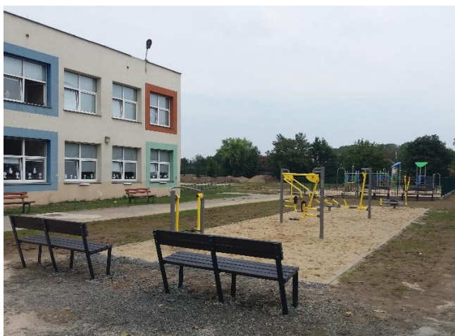
W trakcie prac