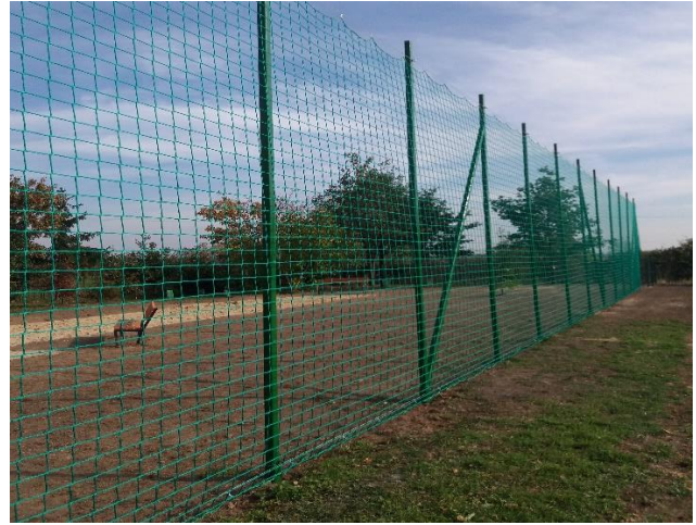
Miejsca do uprawiania aktywności fizycznej