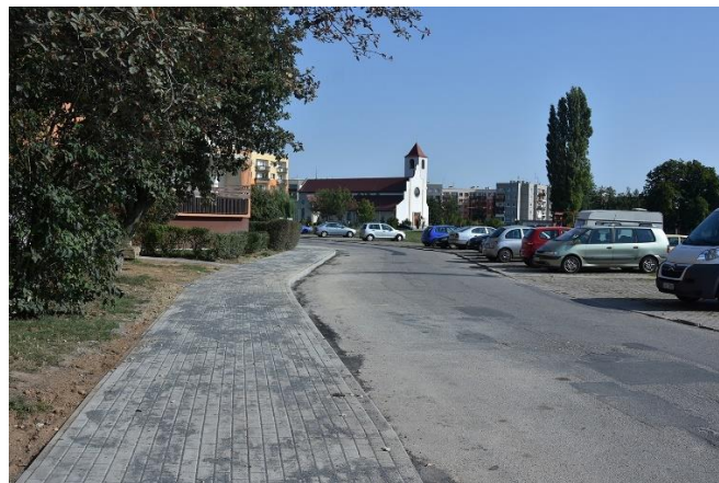
Nowy chodnik zastąpił popękany

✚ „Termomodernizacja obiektu przy ul. Starojaworskiej 82 w Jaworze” . Zadanie było realizowane w latach 2017-2018, łącznie poniesione koszty: 997.423,67 zł brutto. W ramach zadania wykonano między innymi: wymianę stolarki okiennej, ocieplenie stropu, odtworzenie elewacji z zachowaniem detali architektonicznych, ocieplenie ścian styropianem, malowanie elewacji, wymianę istniejącej instalacji CO, wymianę istniejącej instalacji stalowej wody ciepłej i zimnej. W 2018 r. wydatkowano 307.808,47 zł.