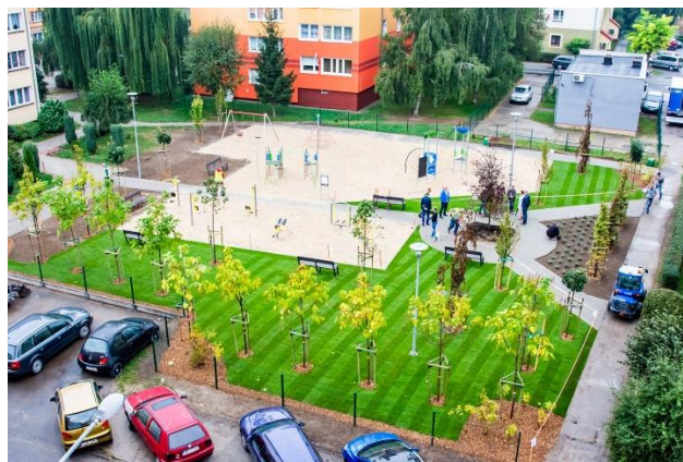
Dotychczas brakowało miejsca do wypoczynku