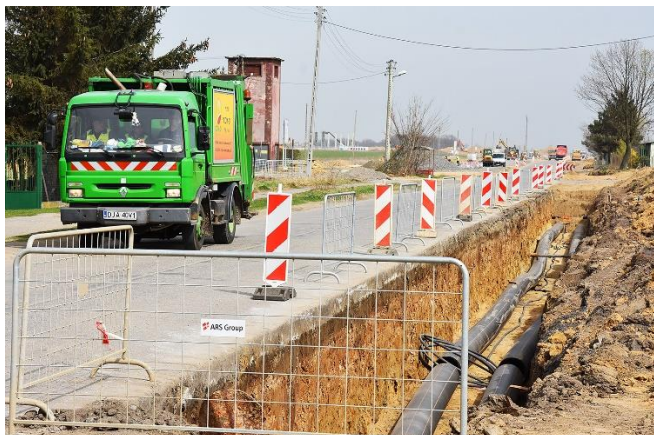
W trakcie budowy