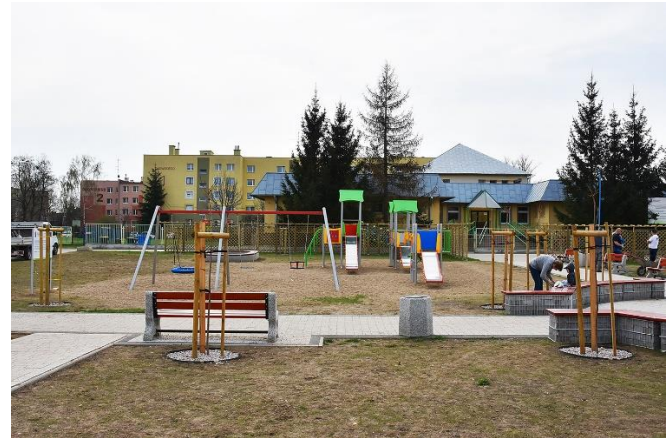
Duża ilość sprzętu dla dzieci sprawia wielką radość

✚ „Modernizacja infrastruktury rekreacyjnej na zbiorniku wodnym Jawornik”. Poniesione koszty: 130.000,00 zł. W ramach zadania wykonano modernizację pomostu na OW Jawornik, utworzono strefę biwakową oraz zakupiono sprzęt do uprawniania sportów wodnych.