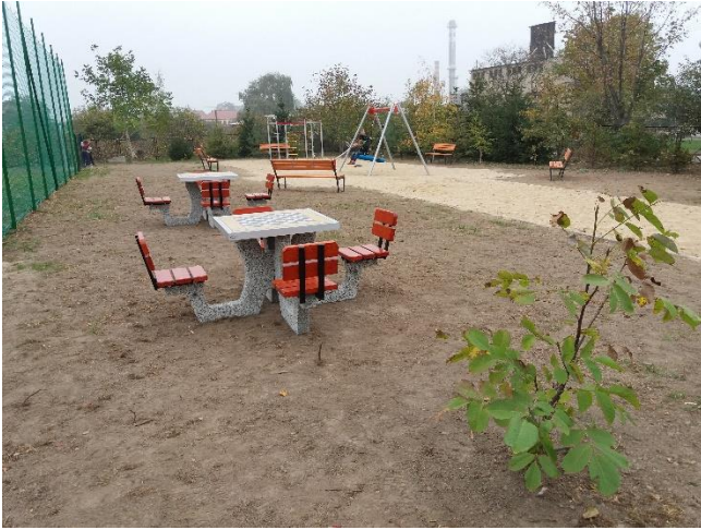
Nowa propozycja dla uczniów SP 4