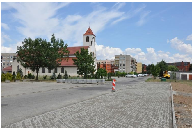
Nowe miejsca postojowe