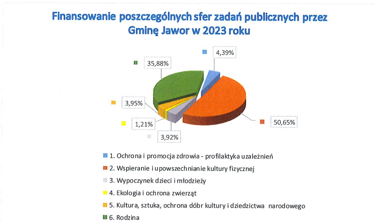
Tab.4. Wykres obrazujący finansowanie poszczególnych sfer zadań publicznych przez Gminę Jawor w 2023 r.

Z powyższego wykresu kołowego wynika, iż rozwój i dofinansowanie sportu stanowi większą część środków przeznaczonych na organizacje pozarządowe. Należy tu podkreślić, iż Gmina Jawor zrealizowała szereg inwestycji sportowych, gdzie tym samym stowarzyszenia sportowe mogą w pełni korzystać z powstających udogodnień rekreacji sportowej, mając tym samym możliwość dalszego rozwoju. Ponadto jak obrazuje poniższy wykres przodującymi dyscyplinami sportowymi jest piłka nożna, siatkówka oraz akrobatyka. Gmina Jawor dofinansowała łącznie 12 dyscyplin sportowych.