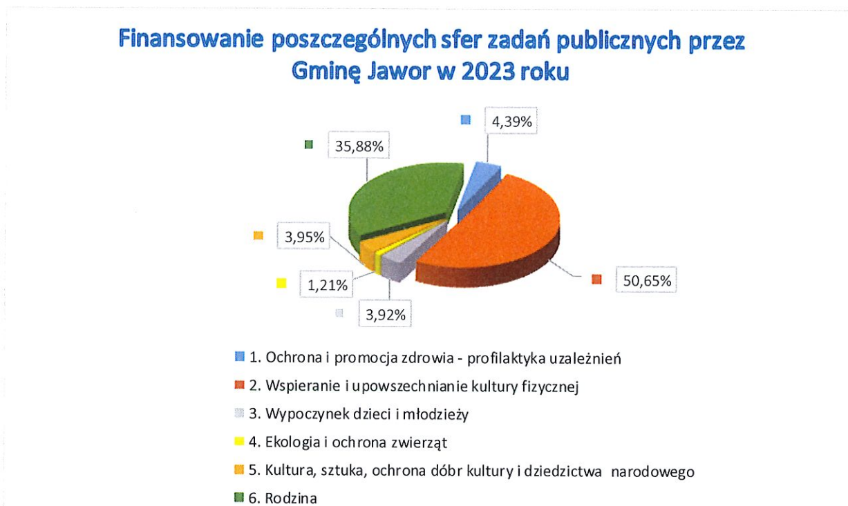
Tab.4. Wykres obrazujący finansowanie poszczególnych sfer zadań publicznych przez Gminę Jawor w 2023 r.

Z powyższego wykresu kołowego wynika, iż rozwój i dofinansowanie sportu stanowi większą część środków przeznaczonych na organizacje pozarządowe. Należy tu podkreślić, iż Gmina Jawor zrealizowała szereg inwestycji sportowych, gdzie tym samym stowarzyszenia sportowe mogą w pełni korzystać z powstających udogodnień rekreacji sportowej, mając tym samym możliwość dalszego rozwoju. Ponadto jak obrazuje poniższy wykres przodującymi dyscyplinami sportowymi jest piłka nożna, siatkówka oraz akrobatyka. Gmina Jawor dofinansowała łącznie 12 dyscyplin sportowych.